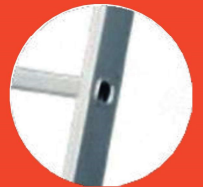
Perfil tubular de aluminio