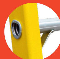
Refuerzos en los peldaños