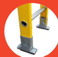
Zapatas de aluminio reforzados con jebes antideslizantes