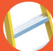
Peldaños con superficie antideslizantes