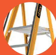
Tapa completa de aluminio reforzado