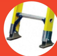
Zapatas ajustables con jebe antideslizantes